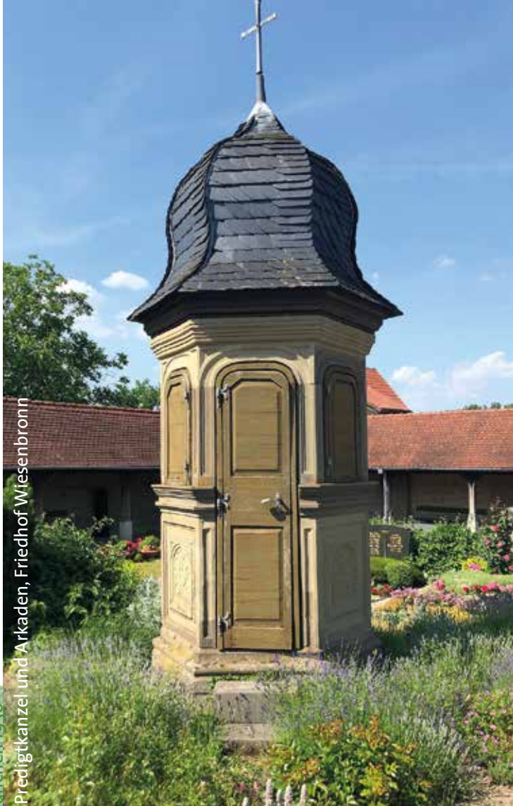
Predigtkanzel und Arkaden, Friedhof Wiesenbronn