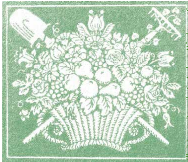
Elly Petersen: Das gelbe Gartenbuch, München 1936