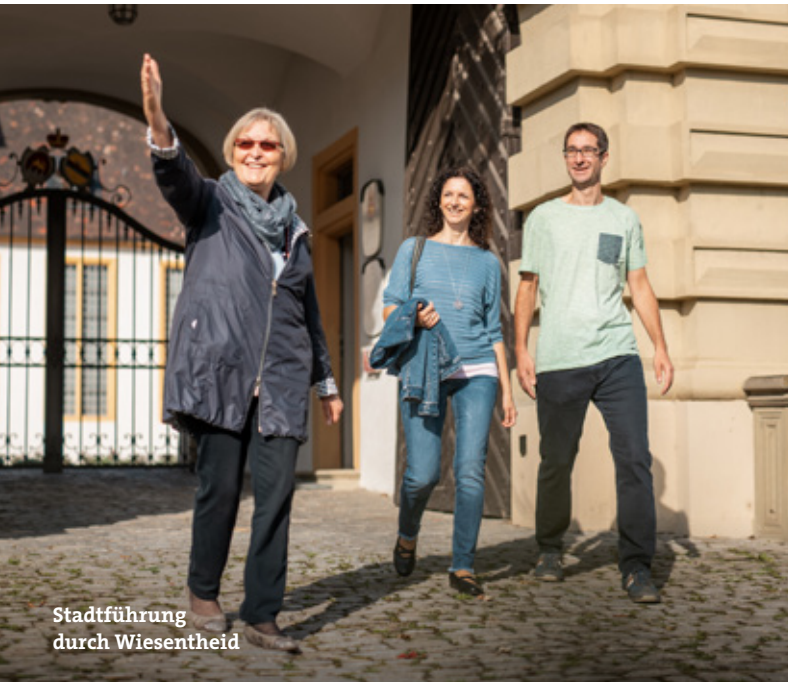
Stadtführung durch Wiesentheid