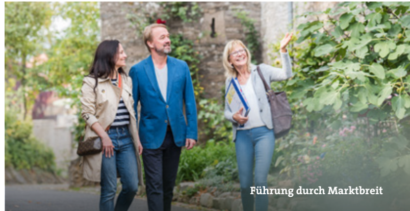
Führung durch Marktbreit

Die schönsten Ausblicke der Volkacher Mainschleife und des Umlandes auf dem neuen Trendgefährt „Segway“ erleben und genießen. In Begleitung eines fachkundigen Segway-Guides oder auf eigene Faust. Individuelle Buchung und weitere Infos siehe Homepage. OenoSegTours – SegwayWeinfranken, Am alten Bahnhof 8, 97332 Volkach, Tel. 09381 / 84797130, www.OenoSegTours.de