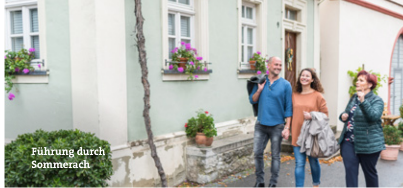
Führung durch Sommerach