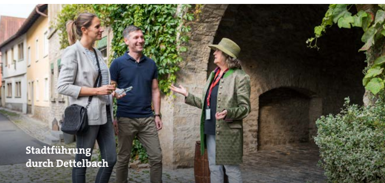
Stadtführung durch Dettelbach