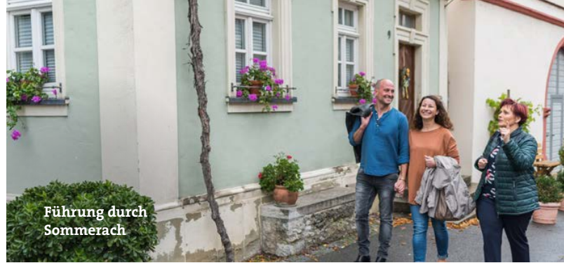
Führung durch Sommerach

2) Dorfspaziergang „Ein Dorf kann faszinieren“ in und um den Weinparadiesort Markt Seinsheim