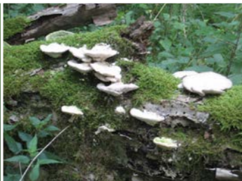
Abgestorbener Baum im natürlichen Kreislauf