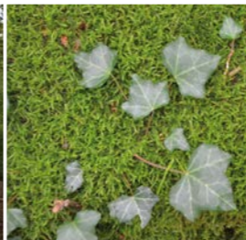
Efeu und Moos