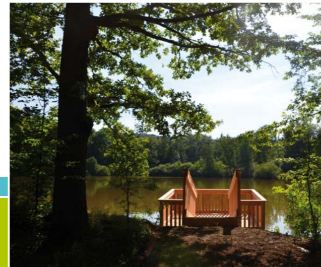
Die Plattform auf dem Großen Wolfsee lädt zum Verweilen, zum Beobachten und zum Entdecken ein