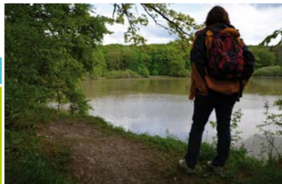
Wanderin am Wolfsee