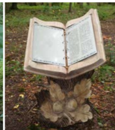
Geschichten aus dem Wald