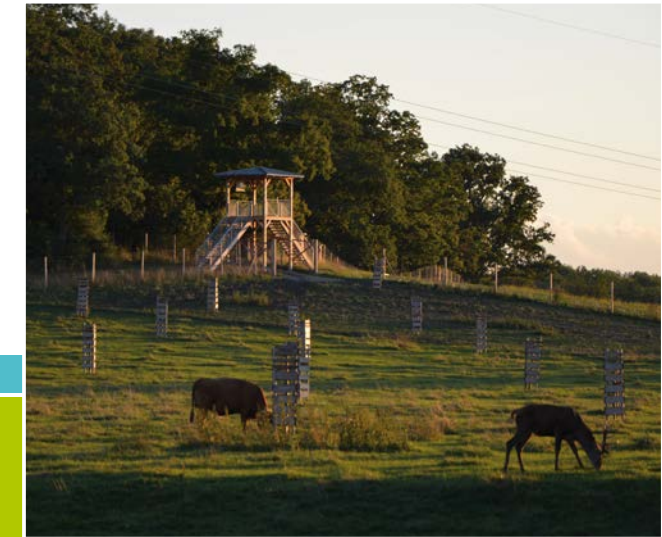
Blick auf den Aussichtsturm über die Hutungsfläche

Die Hutungsfläche in Hellmitzheim wird von den Weidetieren aktiv gestaltet. Durch die Beweidung entsteht eine strukturreiche Wiese Kurzgras – Hochstauden. Sowohl das Rotwild, als auch das Gelbvieh, (alte Hausrindrasse) nutzen den eingezäunten Wald und schaffen hier durch Verbiss und Tritt Strukturen, die im Wirtschaftswald so kaum noch zu finden sind. Am Waldrand entsteht durch die Beweidung eine halboffene Landschaft – Lebensraum für zahlreiche Schmetterlingsarten. Auf den Liegeflächen und Trittstellen entstehen durch die dauernde Nutzung durch die Tiere Rohbodenstandorte, die z. B. von verschiedenen Insektenarten, wie Sandbienen, besiedelt werden. Dunghaufen als Nahrungsquelle locken ebenfalls Insekten an. Die Wasserstelle für die Weidetiere ist gleichzeitig ein Amphibienhabitat, z. B. für die Gelbbauchunke. Die alten Huteeichen sind reich an Spalten und Höhlen. Halsbandschnäpper und Fledermäuse finden dort Unterschlupf und auf der insektenreichen Hutefläche reichlich Nahrung.