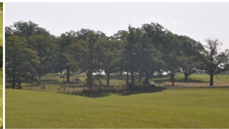
Hutewaldrest mit ca. 200 Jahre alten Eichen